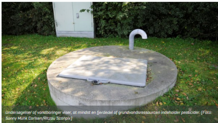
Undersøgelser af vandboringer viser, at mindst en fjerdedel af grundvandsressourcen indeholder pesticider.

KRONIK: Store dele af grundvandet er forurenet af pesticider, men med nødvendige og tidssvarende teknologier produceres der fortsat godt og sikkert drikkevand, skriver professor Hans-Jørgen Albrechtsen.