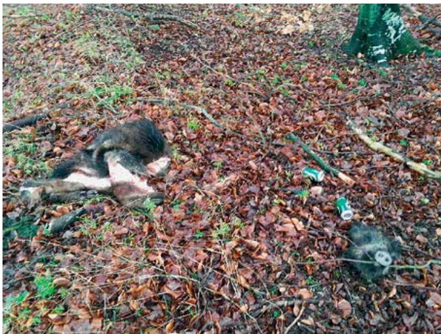
Vildsvineskind og -hoved henkastet på dansk rasteplass.

gere, dels øges reproduktionsraten i takt med nedskydningen.