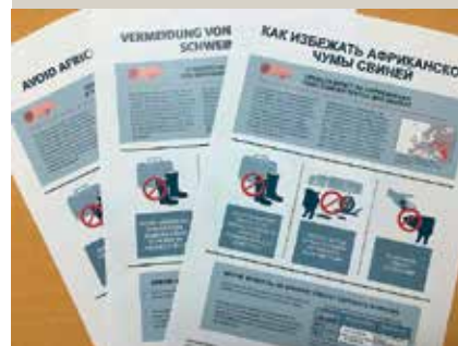
Figur 3. Sørg for at informere medarbejdere om smittebeskyttelse i besætningen. Plancher som disse kan hentes hos SEGES (svineproduktion.dk/viden/i-stalden/management/vejledninger/afrikansk_svinepest).