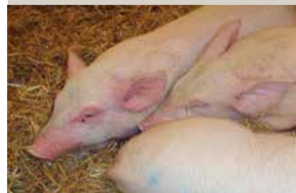
Figur 2. Svin med afrikansk svinepest. Der er nedsat aktivitet i stien, og man ser rødlig misfarvning omkring snude og ører på den ene gris.

En nærmere beskrivelse af symptomer inkl. billedokumentation kan findes her: